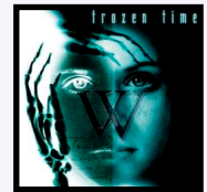
W DémO CD 7 titres