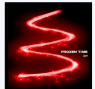
Light DémO CD 5 titres