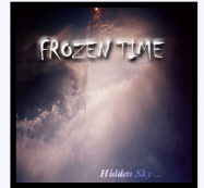
Hidden Sky DémO CD 6 titres