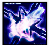
The time has come DémO CD 5 titres